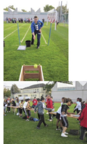
Abbildung 13/14: Impressionen der Puzzle-Biathlon-Stafette am Pilotschulsporttag Zürich