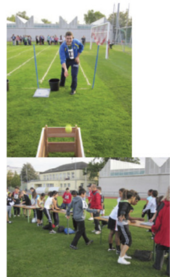
Abbildung 13/14: Impressionen der Puzzle-Biathlon-Stafette am Pilotschulsporttag Zürich